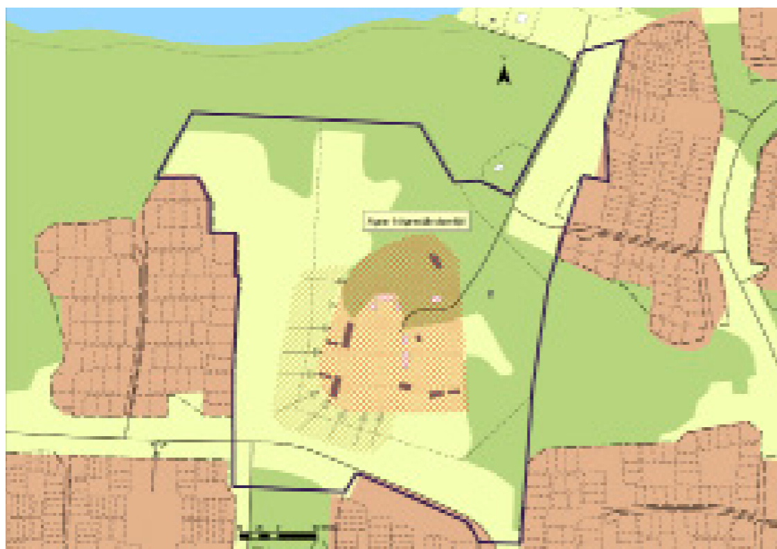
Rekommenderade vyer att behålla /undvika exploatering på (skrafferad yta söder och sydväst om Hallunda gård). Karta och rekommendation från utredning i ref.lista (Pia Nilsson)