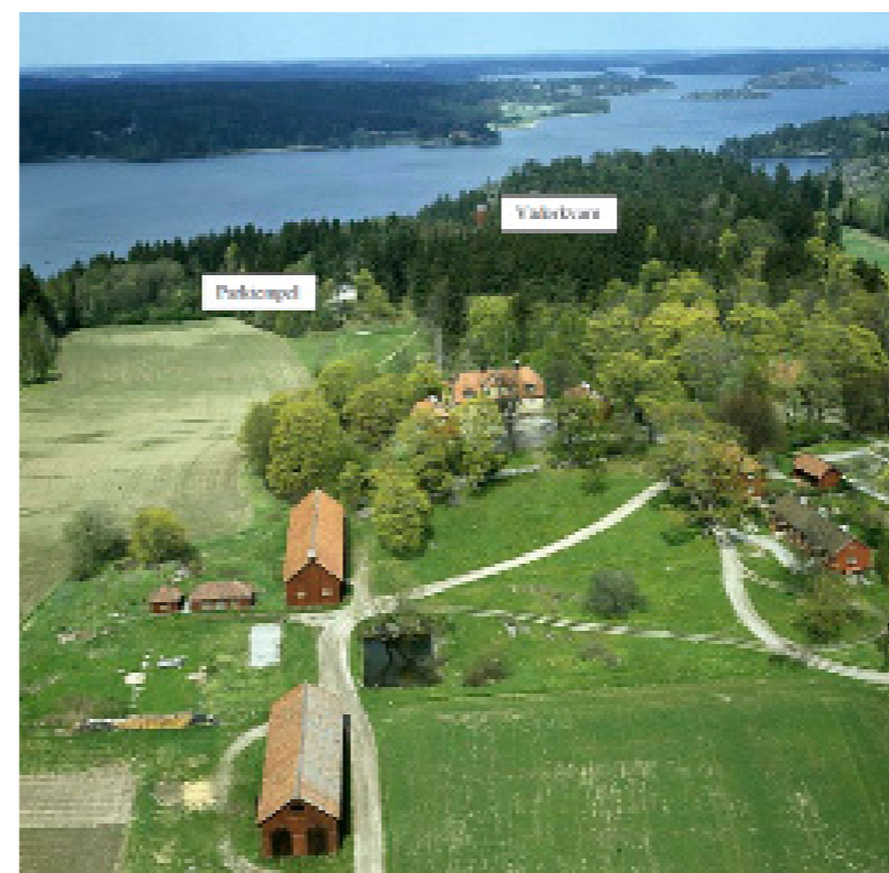
Flygfoto över Hallunda gård.