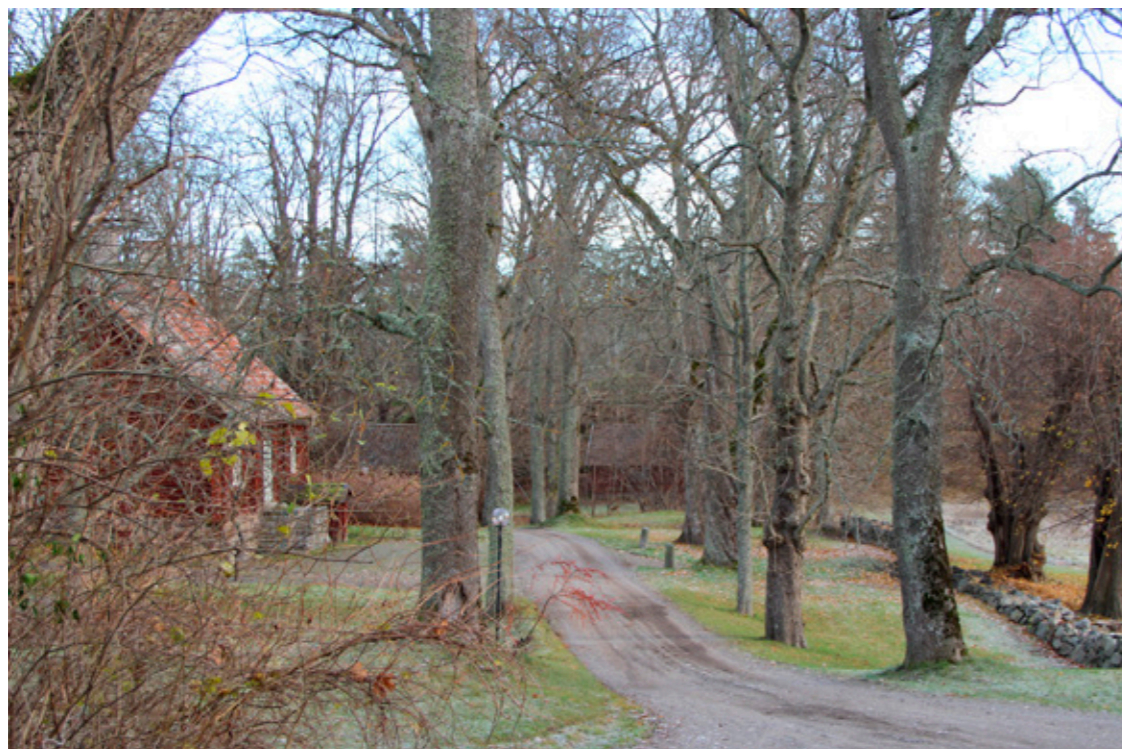
Vy från Hallunda gård mot planområdet