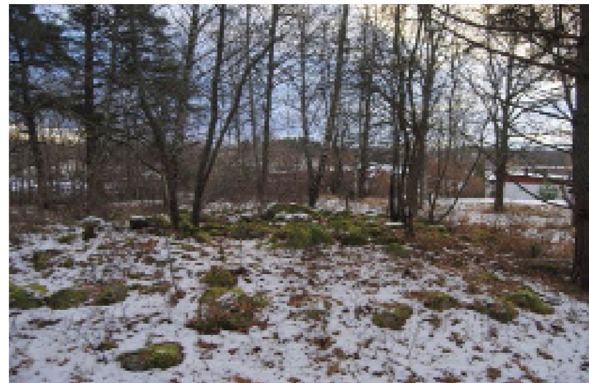
Hallundabopplatsen (Botkyrka 69:1) med gravar, boplots-, handels- och bronsgjuterilämningar ligger på en höjd mellan Hallunda gård och Mälaren.